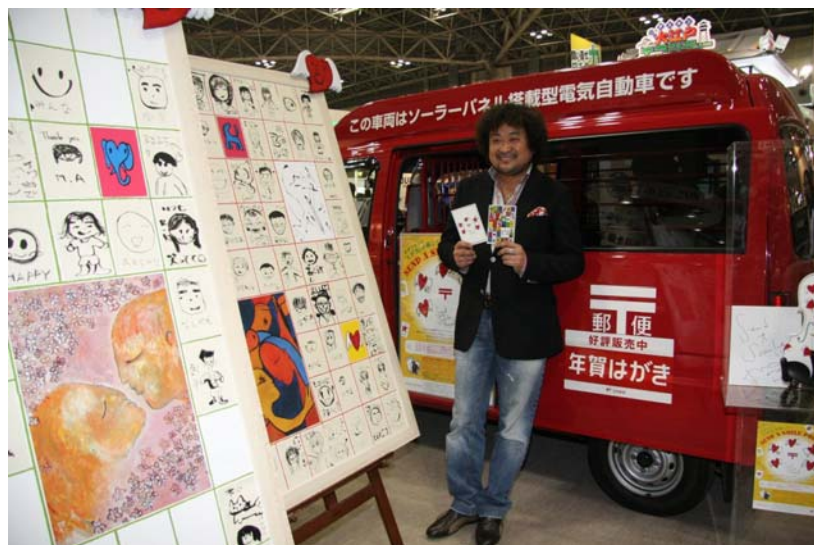
葉加瀬太郎氏と子どもたちとのコラボレーション作品 （平成21年度「Send a Smile Project」イベント会場にて）

会場では、葉加瀬太郎氏の作品約70点や、ウィットに富んだアンティーク絵はがきのほか、公募で寄せられた「えがお」を表現したはがきを展示します。