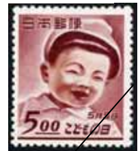
こどもの日記念切手 1949(昭和24)年5月5日発行