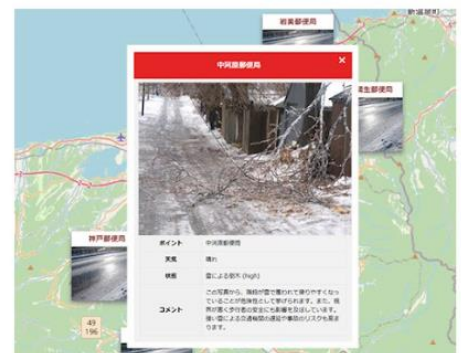
専用webサイト上での表示