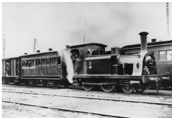
連結された郵便車両