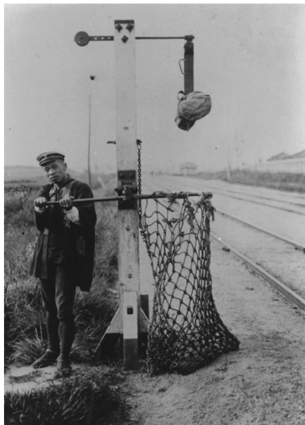
郵便受渡機による授受