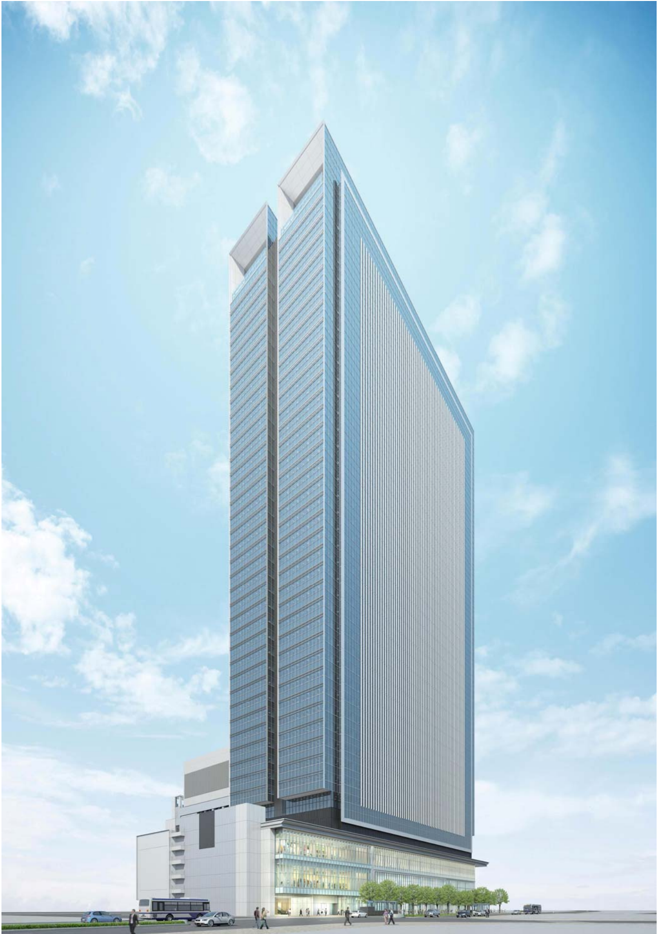
完成予想イメージ図（名駅通からの外観）