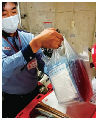
高田郵便局の布マスク積み込み模様