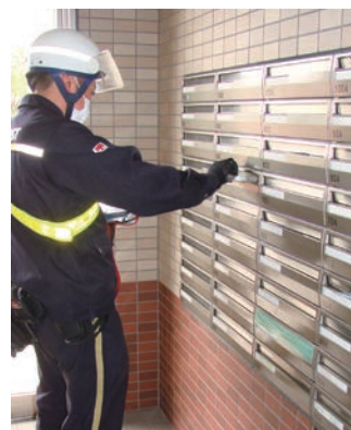
篠路郵便局での布マスク配達風景