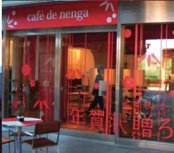
平成19年12月 「年賀状贈ろうweek」を記念し、東京・六本木に巨大ポストが出現。期間中、様々なイベントを開催しました。