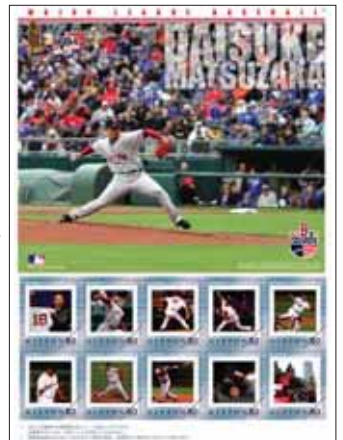
平成20年1月 フレーム切手に 松坂投手が初登板。 松坂投手のメジャーデビューから ワールドシリーズ制覇の軌跡を 写真でつづった フレーム切手を発売。