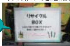
リサイクルBOXの遊休品の回収