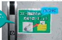
エレベーター前の注意喚起

福岡東郵便局では、平成18年度環境行動計画に基づき、郵便局内の環境への取り組みの共通認識をはかるなど、日常の業務のなかで環境に取り組んでいます。職員だけでなく、施設清掃委託業者に対しても不要電灯の消灯に協力を依頼するなど、郵便局で働くすべての人に働きかけて環境負荷削減の取り組みを実施しています。平成19年度は、さらに「郵政公社版環境マネジメントシステム」の浸透・定着を推進しています。