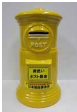
図1：黄色いポスト型の募金箱