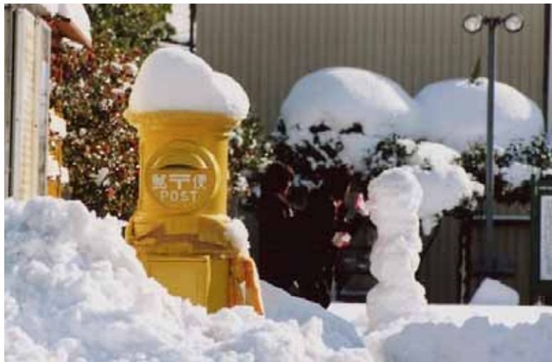
「幸福の黄色いポスト(宮城県大崎市)」

このたびの東日本大震災（東北地方太平洋沖地震）による被災者の皆さまに、謹んでお見舞い申し上げます。